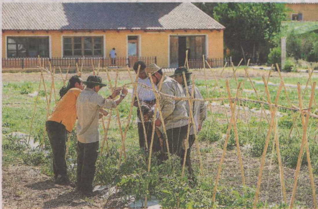
El proyecto Huertos Sociales va dirigido a personas especialmente vulnerables.

Así mismo, la Fundación Ozanam continúa con las actividades de granja-escuela para colegios, en las que han participado 1.400 niños y niñas. Además, durante todo el verano estará en funcionamiento la colonia urbana Torrevirreina, dirigida a la infancia de familias vulnerables. Este año se amplió la capacidad