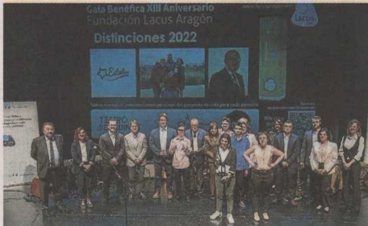
Imagen de los galardonados y otros asistentes.

Tras la entrega de premios, el público asistente pudo disfrutar de la actuación de la Banda del