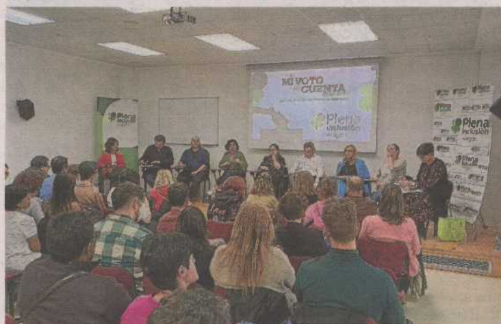
Encuentro de Plena inclusión Aragón con los partidos. FUENTE

voto cuenta' de Plena inclusión pedía que todas las personas con discapacidad pudieran votar.