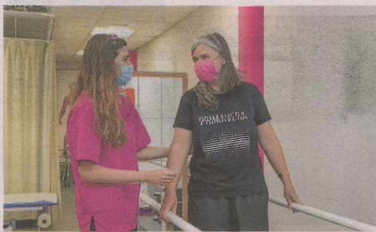
Una persona en rehabilitación junto a la fisioterapeuta.

Un proyecto diseñado de forma específica para dar respuesta a las necesidades de las personas con discapacidad, preferentemente física y orgánica, de la provincia de Zaragoza. Así es el servicio personalizado, estructurado en un conjunto de actividades físicas, sociales, terapéuticas, adaptativas y educativas, que ofrece Fundación Dfa.