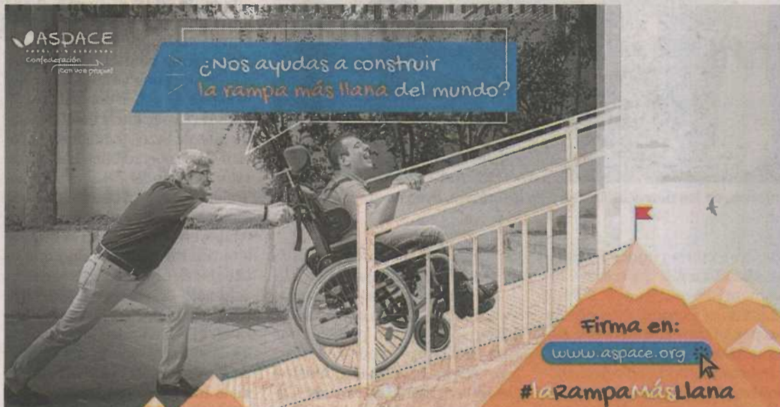
Imagen de la campaña 'La rampa más llana del mundo'.

Zaragoza dan testimonio de esta situación y varias han tenido que hacer el esfuerzo de invertir en este recurso que no está financiado y reivindican que «debería estarlo en todos los casos».